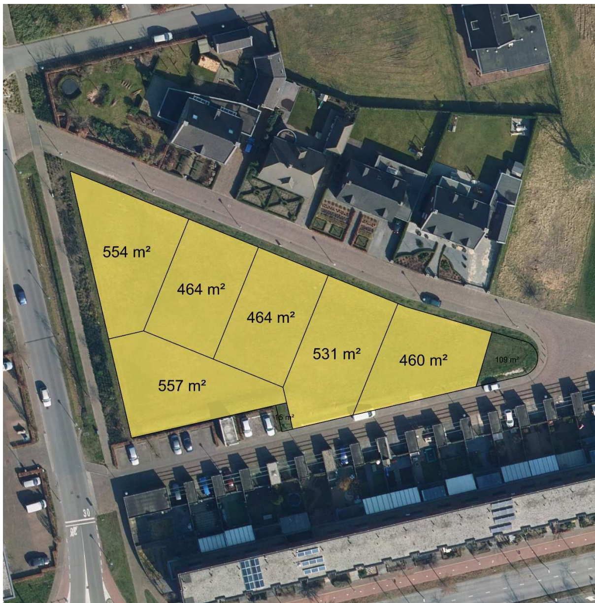
Kaveloppervlaktes bij benadering

De ontsluiting van de kavel aan de Grasbaan voor de auto gaat via de Grasjonker. Voor de compensatie van de inrit van de parkeerplaats op eigen terrein van dit kavel zal een extra parkeerplaats aan de Grasjonker worden toegevoegd.